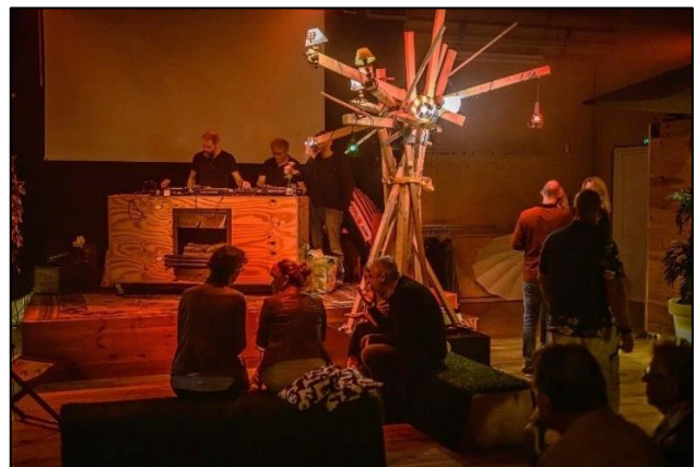
(Aankleding van de binnen- en buitenruimte van Podium Bloos in Breda tijdens de Podiumproeverijen – sept/okt/nov'22)

Deze aandacht voor vorm en inrichting was voor Dyane Donck erg bevredigend, en leidde tot een duidelijke nieuwe ontwikkeling bij haar, waarbij al haar interesses en achtergronden bijeen komen: muziek, theater, beeldende kunst. Deze ontwikkeling zal zich vanaf 2023 verder ontwikkelen, maar was ook van invloed op een eigen initiatief dat al langer in ontwikkeling is, waarin ook Dyane Donck's fascinatie voor 'deep listening' naar voren komt (zie onder).