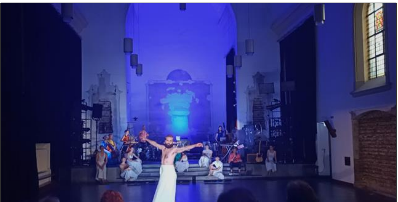
( Lost Intimacy #2 i.s.m. dansers van LeineRoebana in Het Klooster in Breda – juli'22)